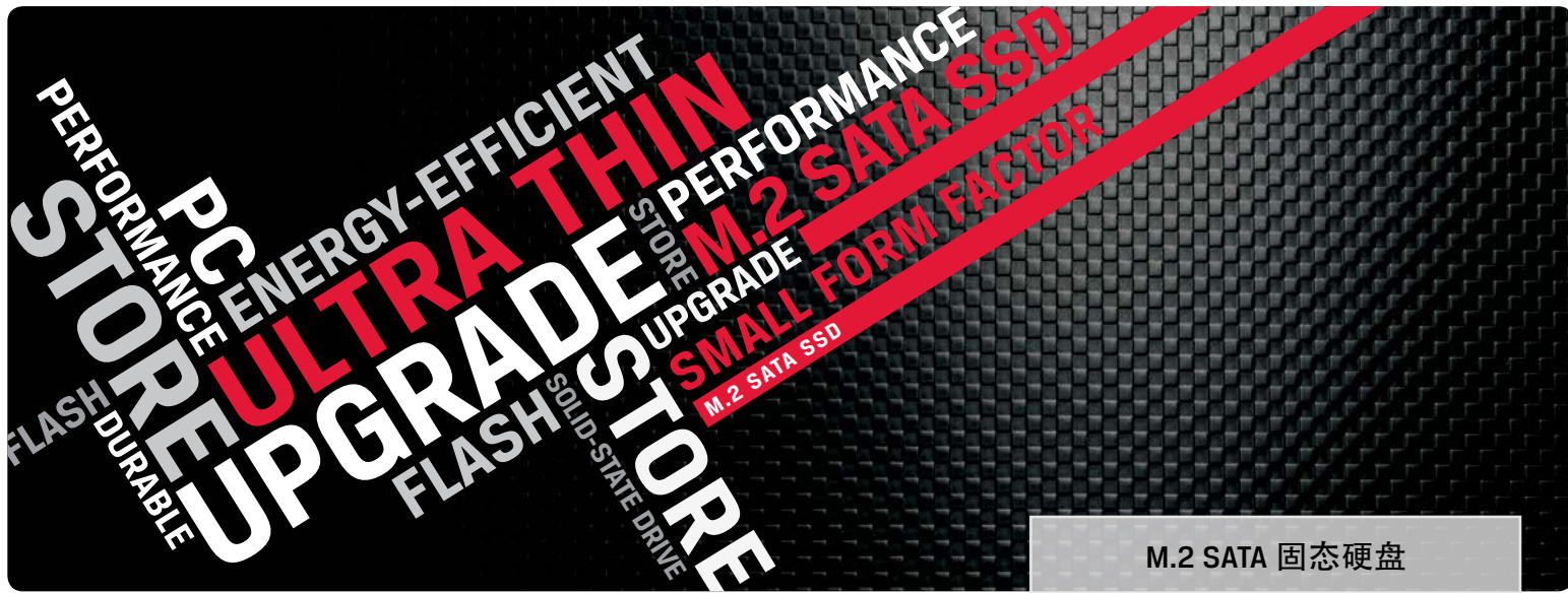
M.2 SATA 固态硬盘